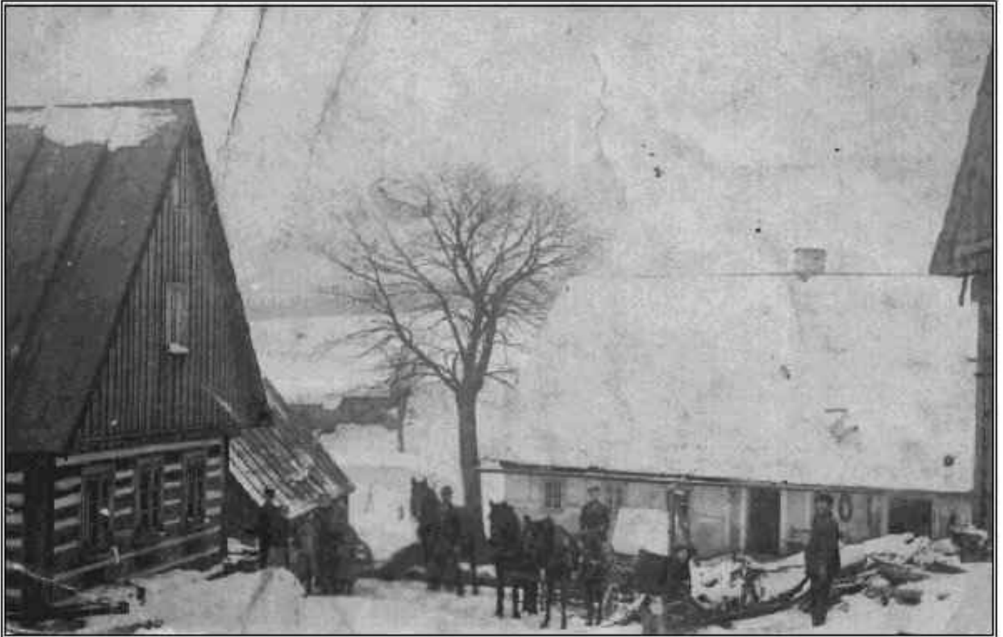
Der Hof in Tassau

Auf dieser Seite ist die genaue Einteilung des Hofes mit Stand vom 13.10.1946 festgehalten: